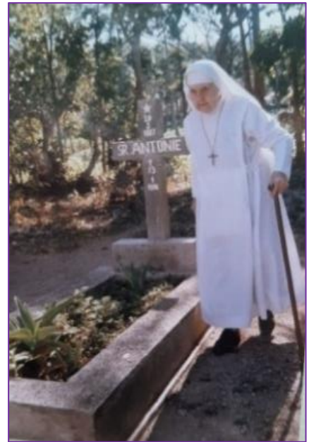
Een medezuster bij het graf van zuster Antonie de Leeuw.

Wagenberg telde in totaal 11 zusters, broeders en paters die in de missie werkzaam waren. Deze oud-dorpsgenoten werden in Wagenberg niet vergeten, de Missienaakring draaide er op volle toeren om de missionarissen van paramenten (kazuifels, kelkdoekjes, etc.) te voorzien, maar er werden ook fancy-fairs georganiseerd om te zorgen voor een financiële steun in de rug.